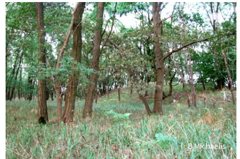
Lichter Wald aus Kiefern und Robinien in den Kaninchenbergen

NABU-Stiftung Nationales Naturerbe Charitéstr. 3, 10117 Berlin Tel. 033 31/26 04 18 00 Fax 033 31/26 04 28 00 Naturerbe@NABU.de www.Naturerbe.de